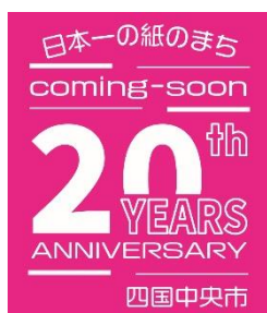
【20 周年記念イベント ロゴ】

なお、民間主催の事業において同様の名称を使用したい場合は、市の要綱に基づき使用することとする。