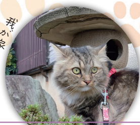
茶々丸（サイベリアン）三島中央