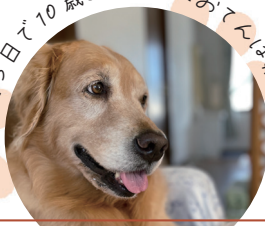
媛（ゴールデンレトリバー）川之江町

昨年よりも少し遅く開花した今年の桜。各地で開催された桜まつりの会場は、写真を撮ったり、お弁当を食べたりする多くの方でにぎわっていました。いつもは「花より団子」な私。今年は美しい桜を見て楽しむ春になりました。(T)