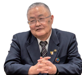
四国中央市長 篠原 実