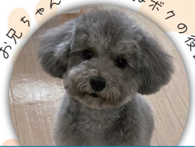
るい（トイプードル）妻鳥町