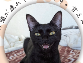
はる（黒猫）中之庄町