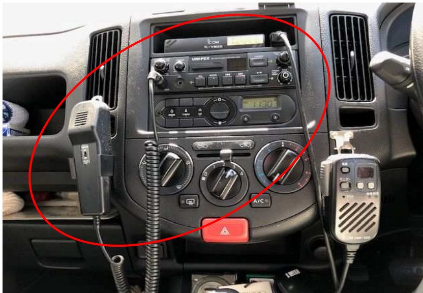
無線機器設置状況（参考）