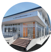
東部学校給食センター

学校給食をより良いものにするために、市内に3つある共同調理場（給食センター）の運営について、必要な事項を審議します。