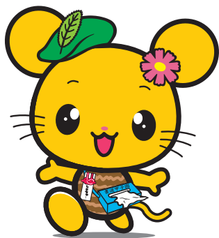
四国中央市マスコットキャラクター しこちゅ〜