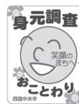
身元調査おことわりステッカー

身元調査を無くすため、玄関先などへの「身元調査おことわりステッカー」の貼付にご理解・ご協力をお願いいたします。