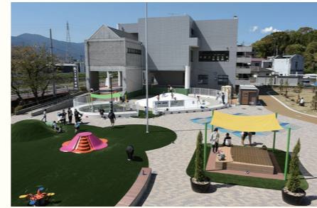
【川之江地区整備事業】 3 億 5,206 万円