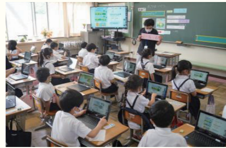
【GIGA スクール構想推進事業】 9 億 4,885 万円