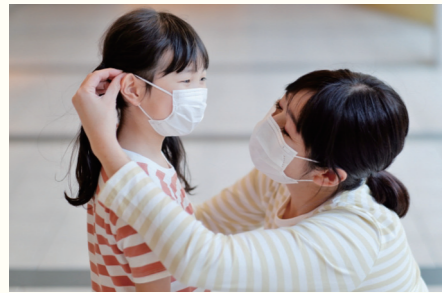
【コロナ対策関連経費】 ※ GIGA スクール構想推進事業を除く 101 億 3,792 万円