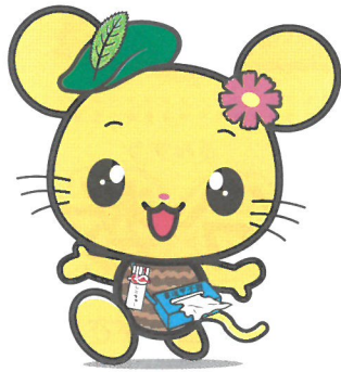
四国中央市マスコットキャラクター しこちゅ〜