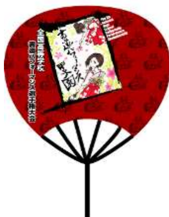
【パフォーマンス甲子園PR面（仮）】