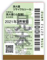
既販品用シール(見本)