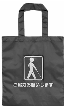
※ナイロン製トートバッグ (サイズ) W 37cm×D 13cm×H 42cm