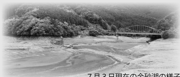
7月3日現在の金砂湖の様子