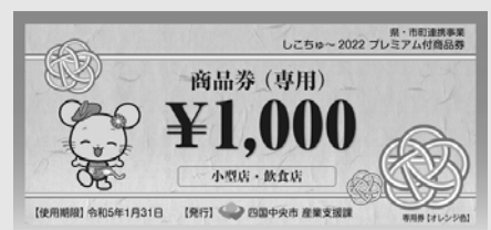
オレンジ色の「専用券」