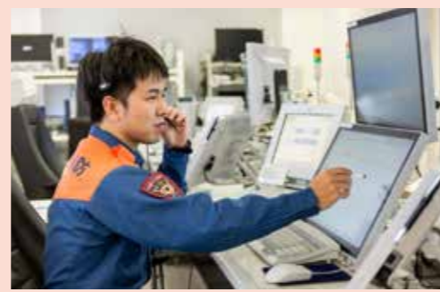
高機能消防指令システム更新事業 2億5,630万円