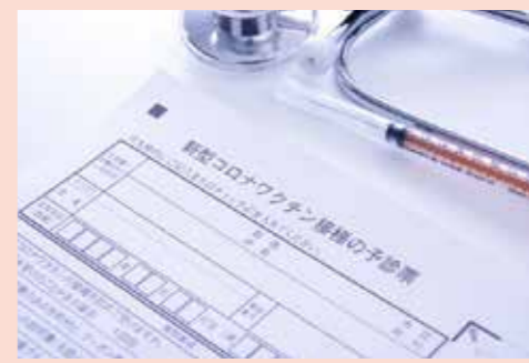
コロナ対策関連経費 (小・中学校施設トイレ改修事業を除く) 47億1,682万円