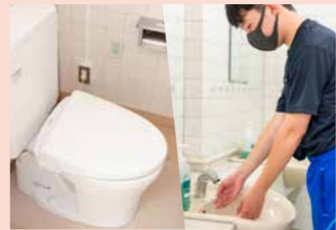
小・中学校施設トイレ改修事業 4億8,818万円