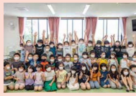
松柏小児童クラブ整備事業 6,662万円