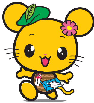
四国中央市マスコットキャラクター しごちゅ〜