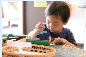
霧の森スタンプラリー など