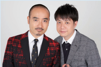
キングオブコンテスト覇者で劇団も持つかもめんたる。2人が自らの世界観を語り尽くします。

※全席自由 ※完売した場合、当日券の販売はありません ※2歳以下は大人1名につき1名までひざ上鑑賞可