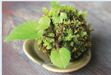
苔玉づくり体験教室