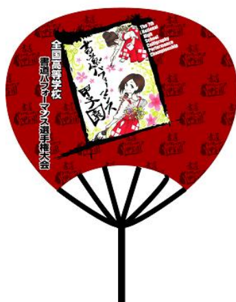
【書道パフォーマンス甲子園PR面（仮）】