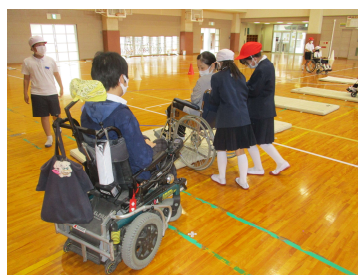
妻鳥小 車いす体験