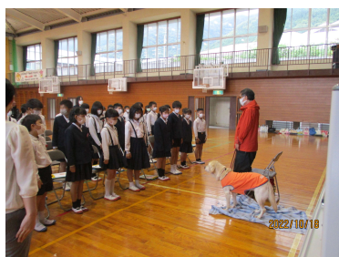
寒川小 盲導犬の学習

次世代に活躍するボランティア活動の人材を育成するため、点字や手話、盲導犬の学習、白杖や車いす体験を、小学校11校、高校2校において計33回開催した。