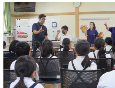
新宮小 手話の学習