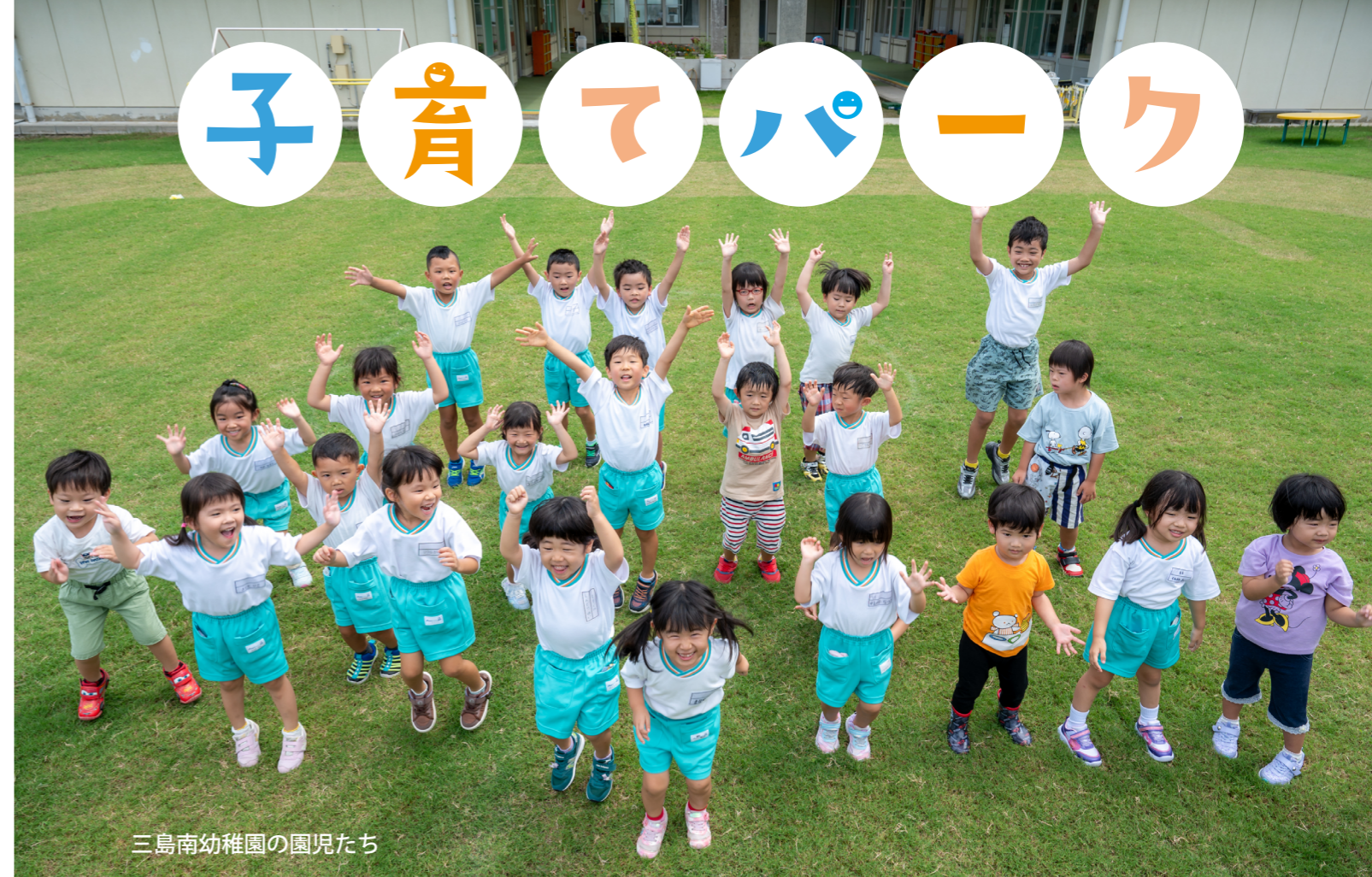
三島南幼稚園の園児たち