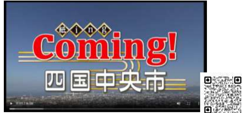
【映像】移住促進プロモーション（4分）