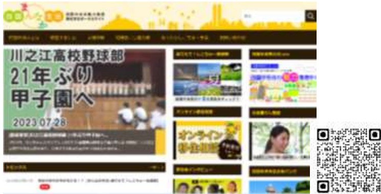
【移住】四国まんなか生活