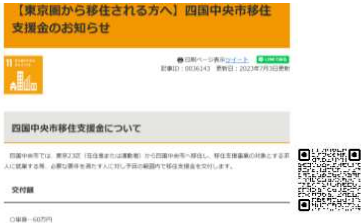
移住支援金のお知らせ【東京圏からの移住】