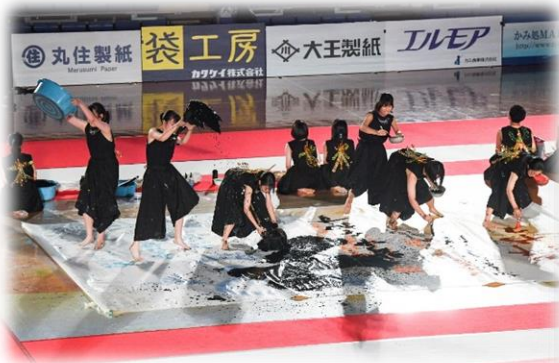
(書道パフォーマンス甲子園)