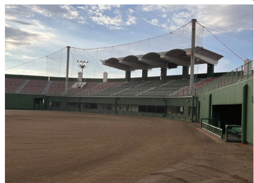
(浜公園川之江野球場)