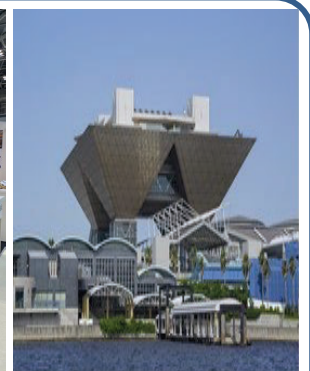
(東京ビッグサイト)