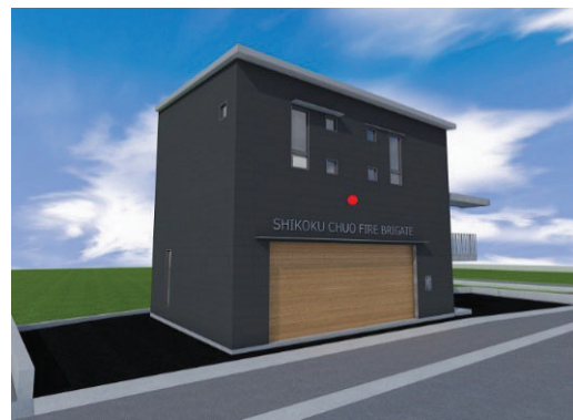
(詰所完成イメージ)