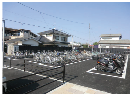
(伊予三島駅南口駐輪場)