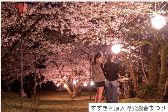
すすきヶ原入野公園春まつり