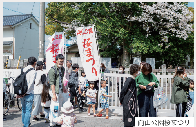
向山公園桜まつり