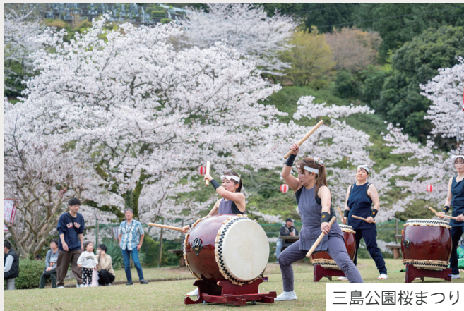
三島公園桜まつり