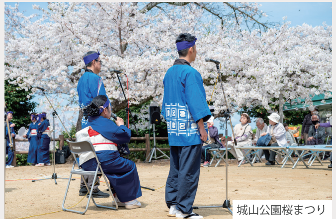
城山公園桜まつり