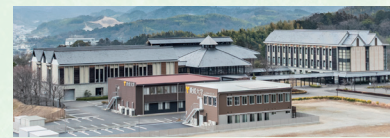
▲紙産業技術センターなどの施設群

に向けて、愛媛大学イノベーション創出院・紙産業イノベーションセンターや愛媛県産業技術研究所紙産業技術センターなどの研究機関と連携した技術開発への支援を実施する。