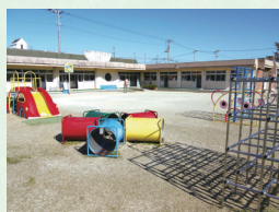
▲建て替える土居保育園

土居西認定こども園の周辺整備については、近隣の土居小学校や土居中学校周辺の通学路を含む広範囲での安全対策が必要であると考えており、歩行者や自転車、車両の通行を明確に分離するための歩道整備や自転車通行帯設置など、地域の皆さまと連携を図りながら、今後、事業化に向けた調査や研究を進めていきたい。いずれにしても、土居地域のインフラ整備を着実に進めることで、地域住民の生活基盤を向上させるだけでなく、地域全体の活性化につながる「まちづくり」に取り組んでいく。