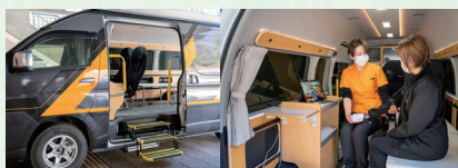
▲医療 MaaS と診療イメージ

今後も、地域の実情を踏まえながら、その他の地域への拡充も含め、住み慣れた地域で暮らし続けられるよう受診環境の確保に努めていく。