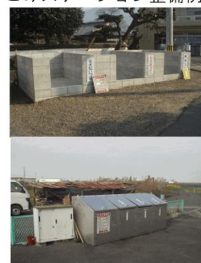
ごみステーション整備例

※本事業の実施に当たっては、補助金枠に限りがあること、地域の諸事情を踏まえて計画していただくことからあらかじめ生活環境課ごみ減量推進係までご相談ください。