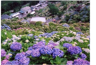
新宮あじさいの里