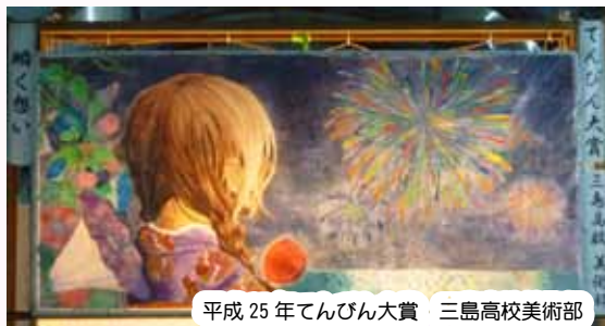
平成25年てんびん大賞 三島高校美術部

夏の風物詩 てんびんの絵(書)書いてみませんか？ 「飾るてんびん」の絵(書)募集！！