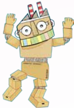
紙まつりおどりロボ

紙にこだわったファッションショーに参加してみませんか？ 紙・コレクション 2014 参加者募集！！