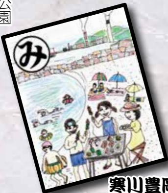
寒川豊岡海浜公園