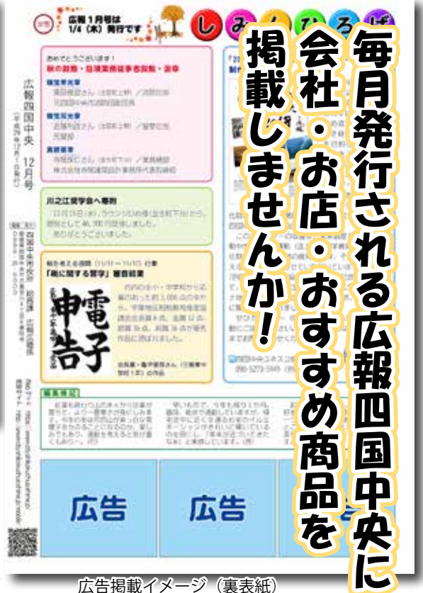
広告掲載イメージ (裏表紙)