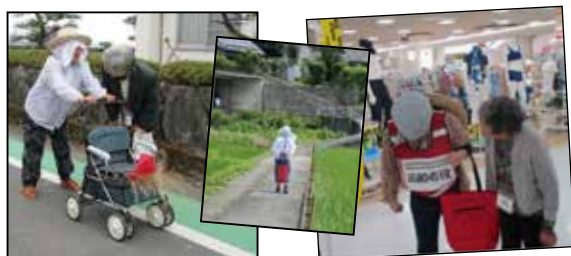
高齢者役の方へ声かけしている様子