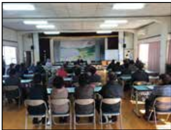
昨年度の講演会の様子

より身近に考えやすい、遺言についても触れる内容となっています。専門家からの分かりやすい講話と、直接質問できる時間も設けていますので、どなたでもお気軽にご参加ください。