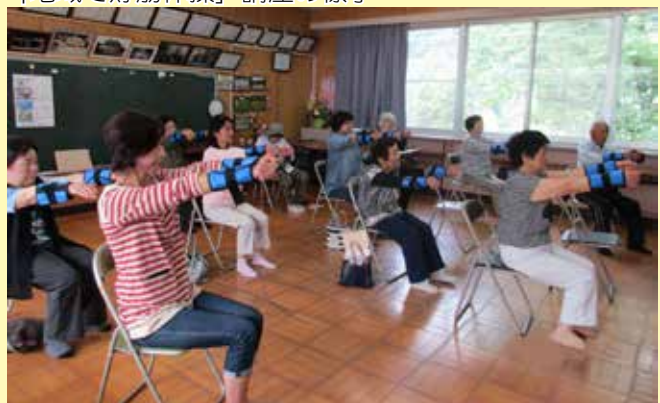
「地域で貯筋体操」講座の様子