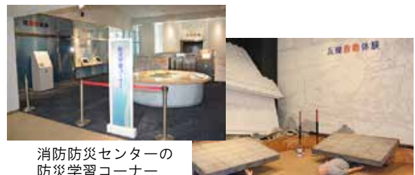
消防防災センターの防災学習コーナー