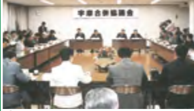
⑮平成13年 任意の宇摩合併協議会が発足