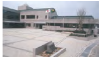
⑨平成8年 土居文化会館（ユ一ホール）完成