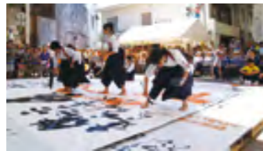
㉔平成20年 第1回書道パフォーマンス甲子園