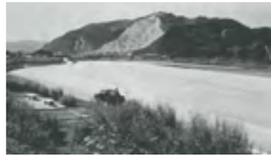
②平成元年 ふるさと広場供用開始