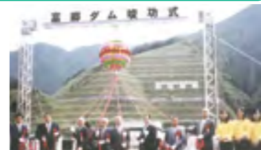
⑭平成12年 富郷ダム竣工