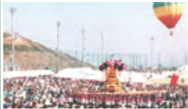
⑦平成6年 やまじ風公園オープン