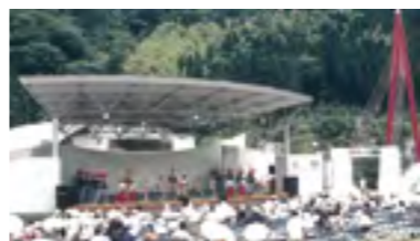
⑪平成11年 霧の森オープン