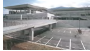
⑲平成16年 土居町総合体育館完成