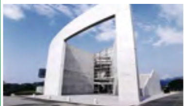
⑩平成11年 かわのえ高原ふるさと館オープン