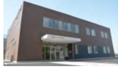
⑳平成30年 愛媛大学紙産業イノベーションセンター完成