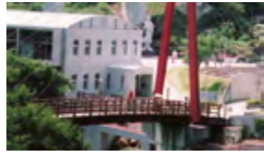
㉒平成17年 霧の森交湯〜館オープン