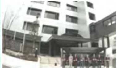
④平成2年 福祉会館完成