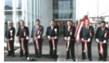
⑱平成15年 川之江図書館開館