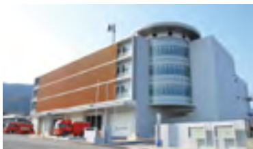
㉖平成27年 消防防災センター完成