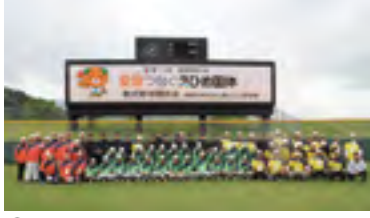
㉙平成29年 愛顔つなぐえひめ国体開幕