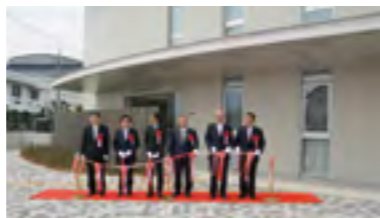
㉘平成29年 パレット開所