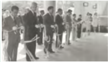
①平成元年 伊予三島市民体育館完成