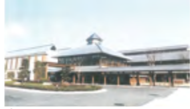
⑯平成15年 県紙産業研究センターオープン