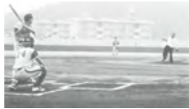
⑥平成4年 川之江市民野球場オープン