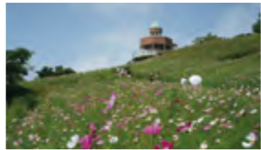
⑧平成6年 伊予三島市花にコスモス