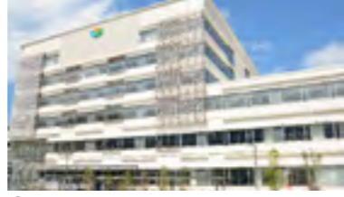
㉑平成30年 新庁舎完成業務開始