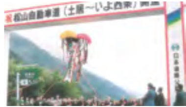
⑤平成3年 松山自動車道土居IC〜いよ西条IC間開通