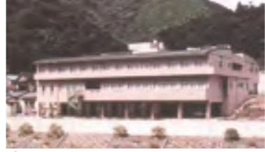
⑰平成15年 国保診療所完成