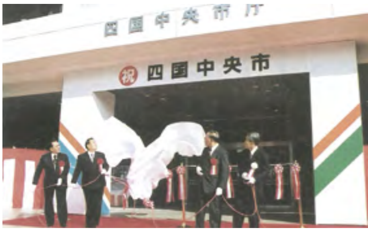
⑳平成16年 四国中央市誕生