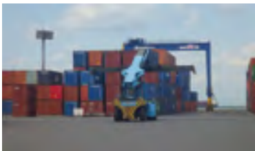
㉓平成20年 三島川之江港「多目的国際ターミナル」