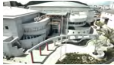
③平成2年 川之江市民体育館完成