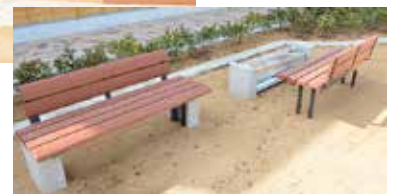
園庭に設置されたかまどベンチ