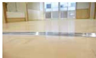
転倒やつまずき防止のフラットレール