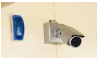
陰になる場所にはカメラを設置