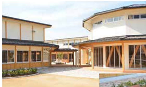
一体的に活用できる交流ゾーン

「園庭」「遊戯室」「エントランス広場」を一体的に地域に開放することによって、地域交流の場として活用したいと考えています。