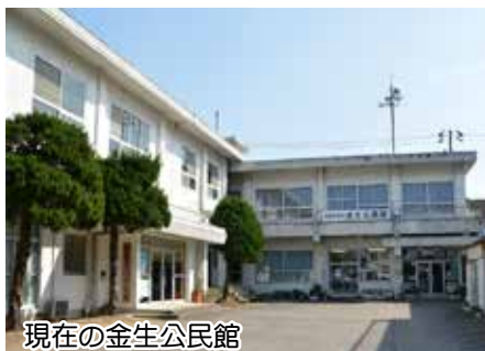
現在の金生公民館

なお、工事予定期間は 3 月から平成 32 年 1 月末までの 11 か月間です。