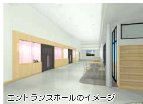
エントランスホールのイメージ