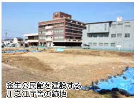
金生公民館を建設する川之江庁舎の跡地