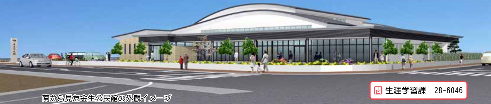
南から見た金生公民館の外観イメージ