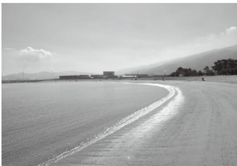
▲寒川豊岡海浜公園ふれあいビーチ