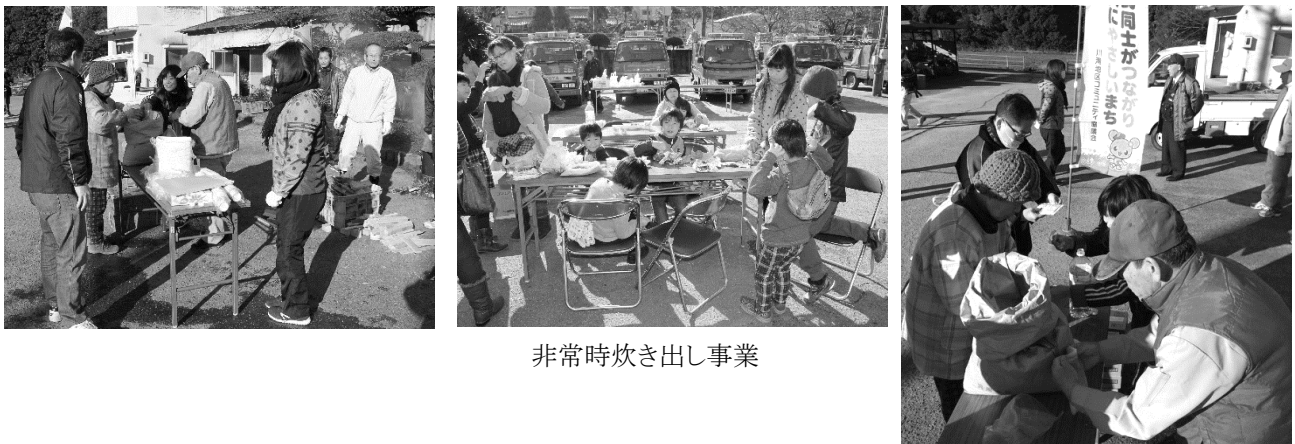
非常時炊き出し事業

万が一の災害に備えるため、大勢の住民が参加する川滝地区三世代交流会に併せて、非常時の炊き出し訓練を実施しました。炊き出しはガスが使えないことを想定し、かまど作りから始めてご飯を炊き上げ、非常食のレトルトカレーを食べました。参加者に災害に備えることの大切さを伝える良い機会となりました。