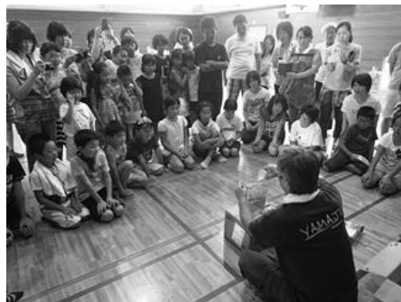
非常食の作り方指導