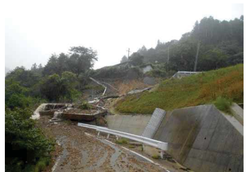
豪雨災害による被災状況（市道吉野瀬線）