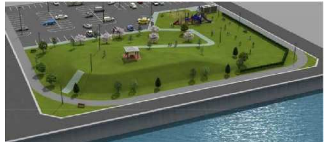
浜公園駐車場・広場（パース）