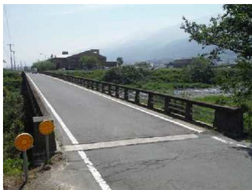
修繕工事を予定している大谷橋(土居町土居~北野)