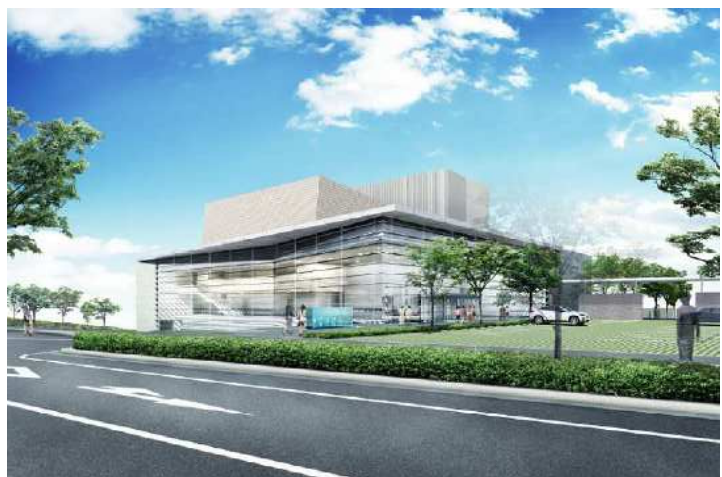
市民文化ホール（パース）