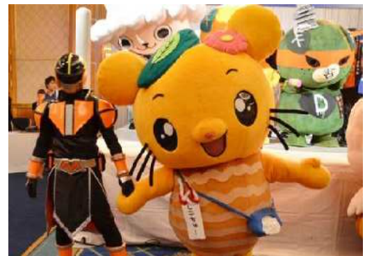
ゆるキャライベントへの参加風景 (松山市)