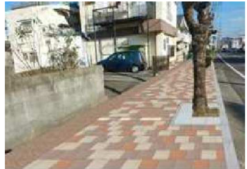
バリアフリー化のイメージ