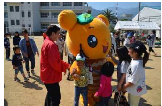
子どもとしこちゅ〜のふれあい風景 (土居区民運動会)