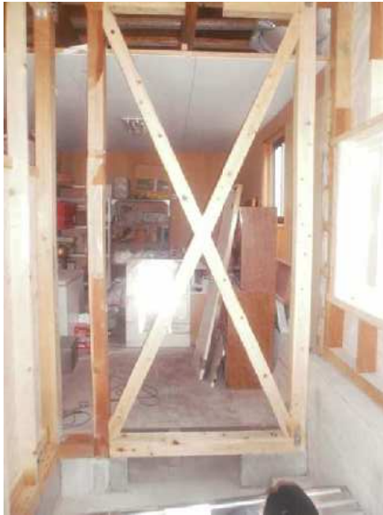
木造住宅耐震化工事の施工状況