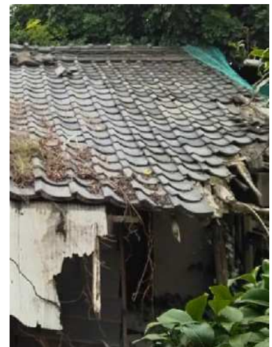
市内の老朽危険空家等の状況

所有者が実施する老朽危険空家等の除却にかかる費用の一部(4/5補助 上限80万円)を補助します。