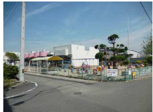
現在の長津保育園