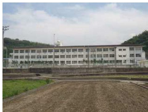
屋根の改修工事を予定している金生第二小学校