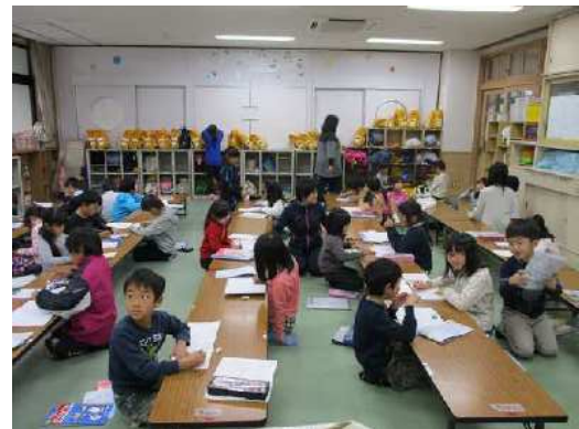
川之江小放課後児童クラブの様子