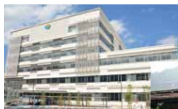
新庁舎建設事業 (総務費)