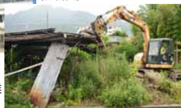
空家等対策事業 (土木費)