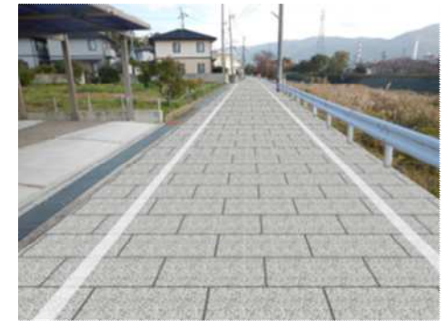
標準区間 (9NO. 3付近)