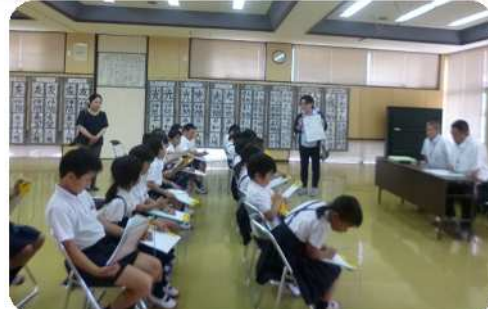
小富士小学校(6月19日)