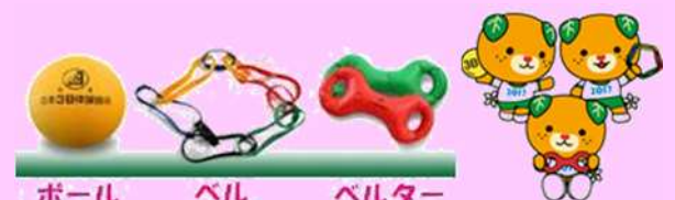
ボール ベル ベルター