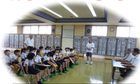
小富士小学校(6月19日)