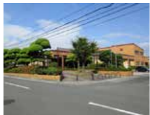
三島図書館 場 三島宮川 4-8-57 問 28-6053