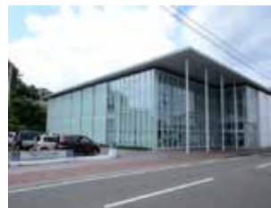
川之江図書館 場 川之江町 2242-1 問 28-6256