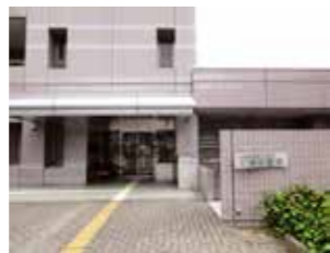
土居図書館 場 土居町入野 939 (ユーホール内) 問 28-6354