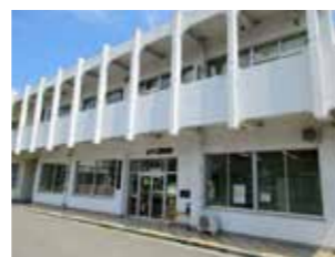
おやか図書館 場 上分町 556-1 (上分公民館内) 問 28-6258