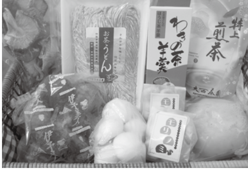
▲新宮ふるさと小包（冬便）のイメージ