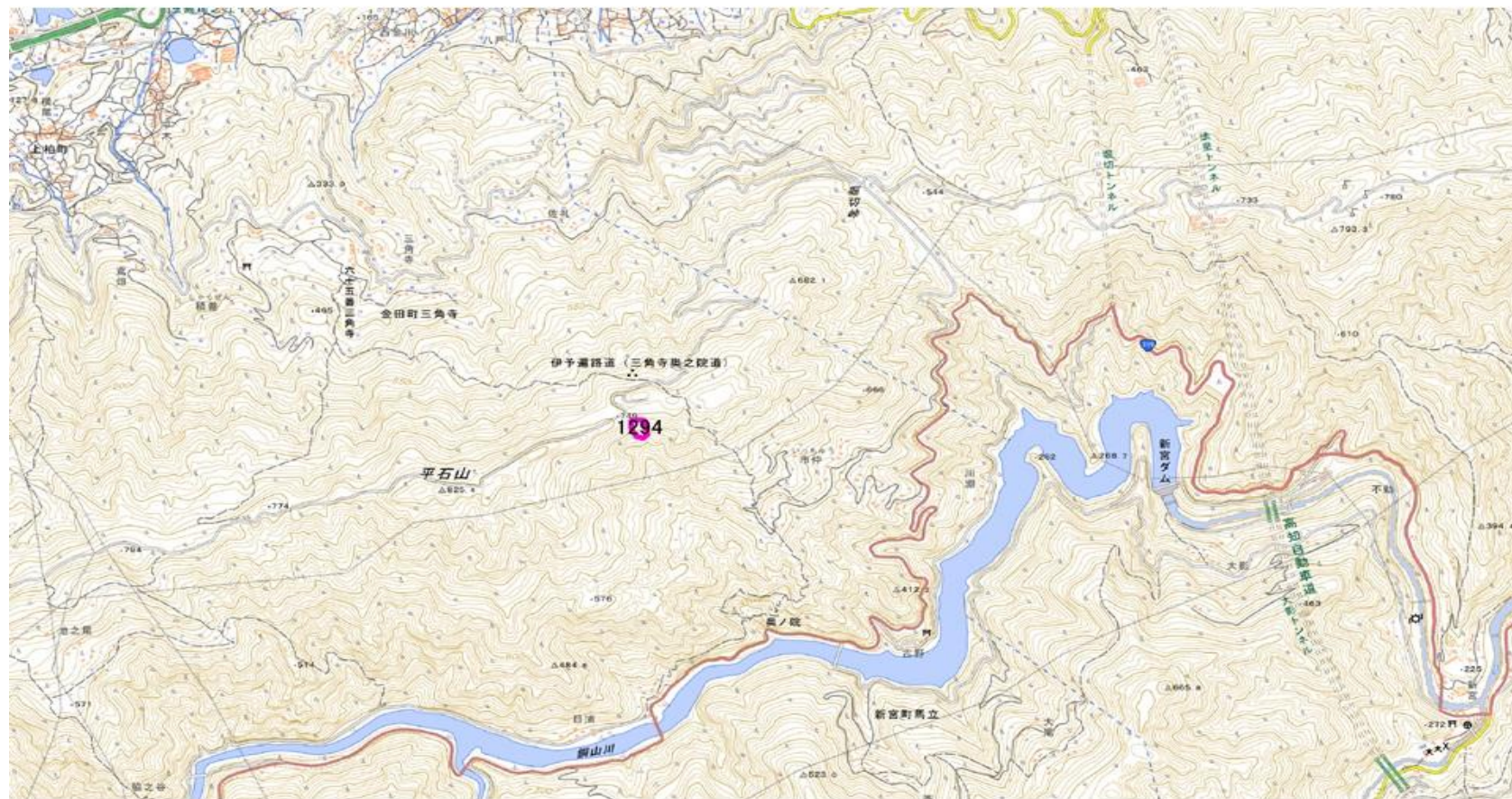
甲が経営管理を委託する意思を表示した森林の位置図