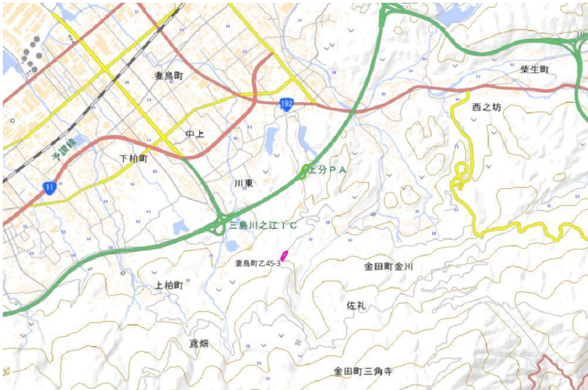
甲が経営管理を委託する意思を表示した森林の広域図