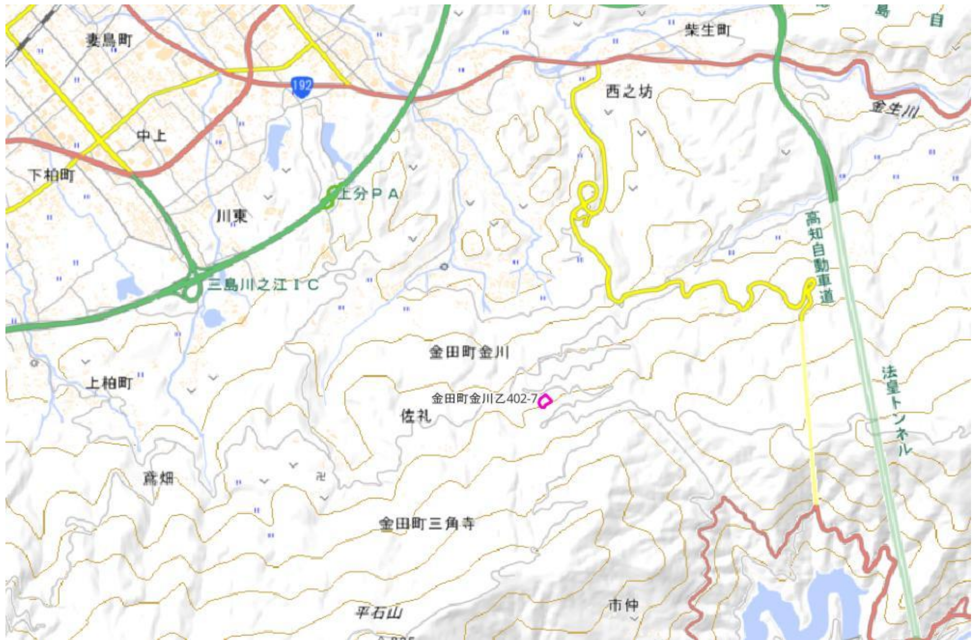
甲が経営管理を委託する意思を表示した森林の広域図