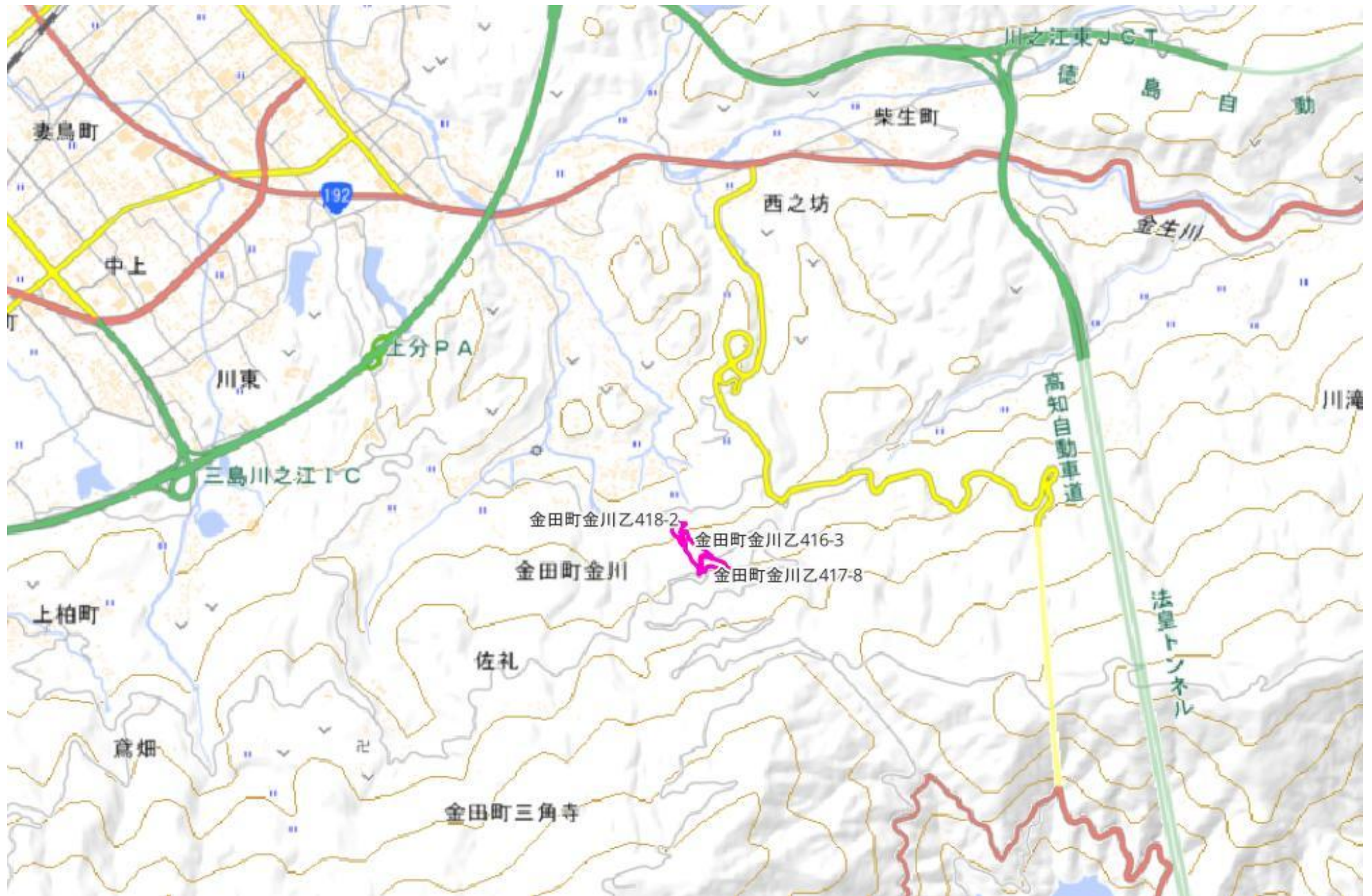
甲が経営管理を委託する意思を表示した森林の広域図